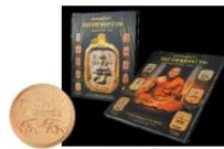
3. หลวงพ่อบาน บริษัท แอภา แบงค็อก จำกัด