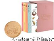
4. หนังสือชุด "บันทึกนีกอรัย" เล่ม 1-4 โดยท่านหญิงประจักษ์ มูลนิธิจิตพัฒนา