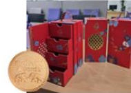
5. Moon Cake MX 4 ชั้น Red บริษัท ฟู๊ด ออฟ เอเชีย จำกัด