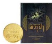
1. เทวรูปพระพิฆเนศชิ้นเอกในศิลปะอินเดีย คุณอิสริศ รุชอ