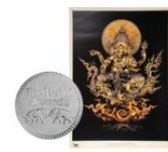
2. พระพิฆเนศเทพแห่งความสำเร็จ 2555 อ.เจสิทธิ์